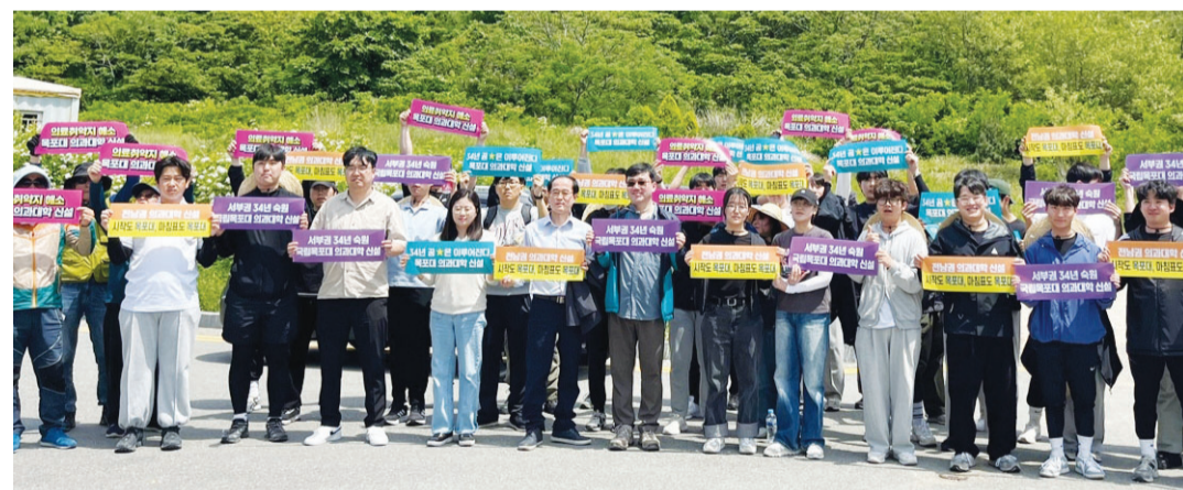
국립목포대학교(총장 송하철)는 지난 17일 목포 고하도 잇마을 해변에서 방치된 해안 쓰레기를 치우는 등 해양 보호 활동을 위한 'ESG 프렌즈 플로깅'을 개최했다.