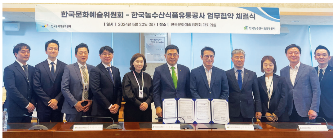
한국문화예술위원회(위원장 정병국)와 한국농수산식품유통공사(사장 김춘진)는 지난 20일 '지속 가능한 미래 사회 조성을 위한 업무협약'을 체결했다.