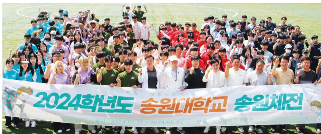
송원대학교(총장 최수태) 제49대 총학생회(회장 최건)는 21, 22일 양일간 송원대 인조잔디구장에서 '안전과 함께 송원 체전'을 열었다.