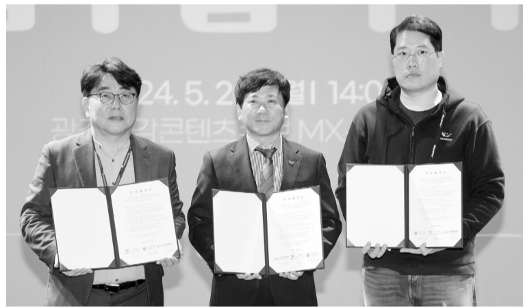
이상갑(가운데) 광주시 문화경제부시장은 최근 실감콘텐츠큐브(GCC)에서 요리 타이쿤(경영 시뮬레이션) 게임 업체 그램퍼스 대표와 업무협약을 체결하고 있다.

지난달부터는 콘텐츠 기업 유치협의체를 구성하고 우량 기업을 중심으로 기업 이전 절차와 특전(인센티브) 상담 활동을 하고 있다.