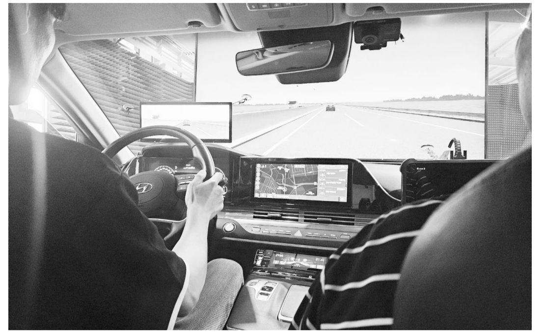
경기도 김포 이노팩토리 공장에서 지난 24일 진행된 AI 대형 드라이빙 시뮬레이터 주요 장비인 'VILS' 시연회 모습.