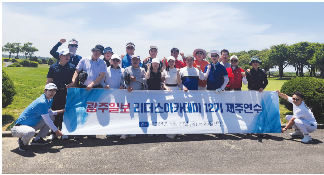
2024 광주일보 리더스 아카데미 12기 하계 연수 프로그램이 지난 23일부터 25일까지 2박3일간 제주 일원에서 열렸다.