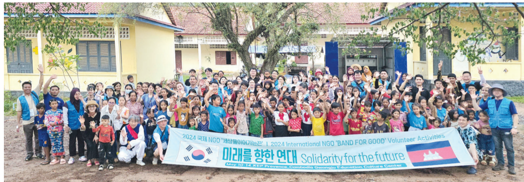
지난 2012년 설립된 ‘국제NGO 세상을이어가는 끈’은 최근 캄보디아 크롱 깡 슛 초등학교 캄보디아 광주교육문화센터에서 무료 진료와 문화행사를 개최했다.

“아이들도 일을 해야만 하는 작은 마을에 사랑받을 수 공장이 들어서고 학교가 생기면서 아이들이 공부하고, 마을 경제도 살아가는 모습을 보고 많은 생각을 하게됐어요. 학교와 공장과 병원을 지을 수 있다면 얼마나 좋을까 큰 꿈을 꿔요. 지금은 교육과 진료를 중심으로 활동하고 있는데 뜻을 같이 하는