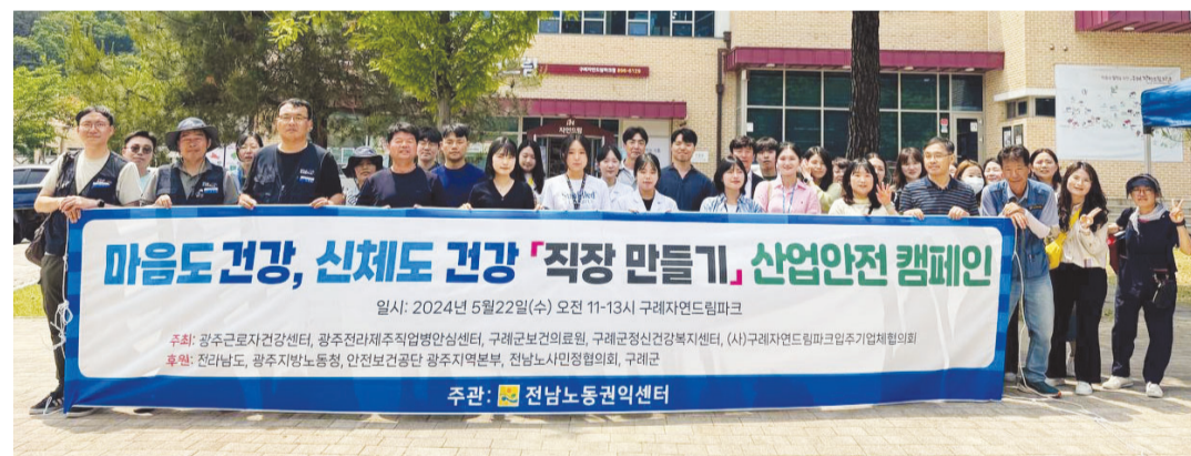
전남노동권익센터는 최근 구례 자연드림파크농공단지에서 고용노동부, 구례군과 함께 ‘찾아가는 농공단지 산업안전 캠페인’ 행사를 개최했다.