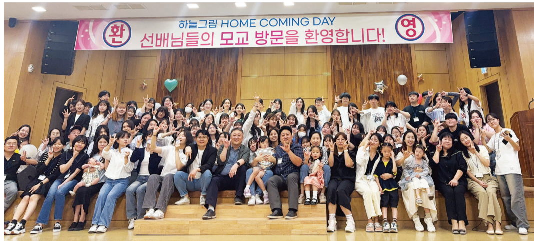
25일 열린 호남대 수어동아리 '하늘그림'의 25주년 '홈커밍데이' 행사 모습.

"수어 통역사가 돼 자신의 길을 개척해 나가는 후배들을 보면 대견하죠. 무엇보다 삶의 현장에서, 자신의 일을 묵묵히 수행하며 열심히 배웠던 수어로 도움을 줬다는 이야기를 전해들으면 기분이 좋습니다. 간혹사로 근무하는 후배는 병원에 찾아온 농아 환자에게 도움을 줄 수 있어 행복했다고 하고, 비행기 안에서 청각 장애인을 도울 수 있어 뿌듯했다는 후배도 있었어요. 다양한 직종의 아르바이트 현장에서 장애인들에게 도움을 줬던 후배들은 '수어를 배우길 정말 잘했다'고 말하곤 합니다."