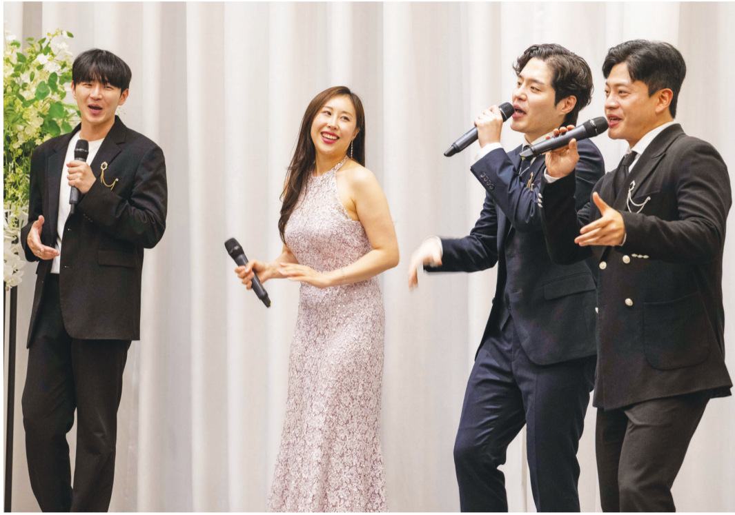
12기 광주일보 리더스 아카데미 두 번째 음악회가 열린 지난 28일 광주시 남구 임암동 어반브룩에서 팝페라 그룹 '볼라레'가 아름다운 목소리로 초여름 밤을 적시고 있다.