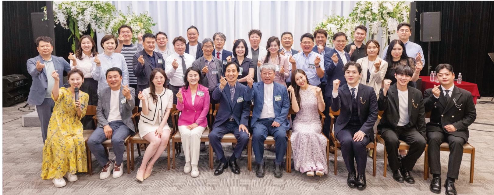
12기 광주일보 리더스 아카데미에 참석한 원우들이 공연이 끝난 뒤 그룹 '볼라레'와 기념촬영을 하고 있다.