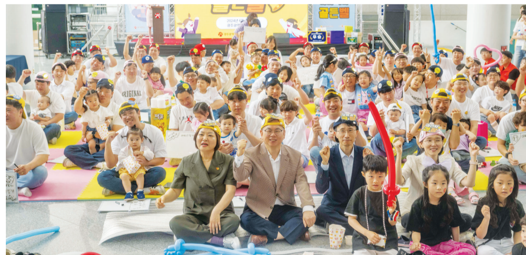
제3회 도전 아빠 육아 골든벨이 1일 오전 광주시청 시민홀에서 열렸다. 고광안 광주시 행정부시장을 비롯한 내빈들과 광주에 거주하는 아빠들이 화이팅을 외치고 있다.