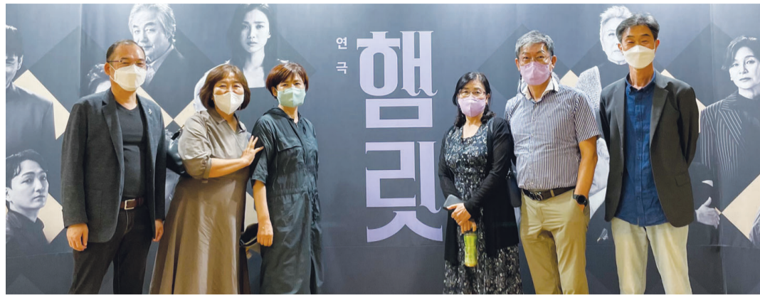
지난 2022년 국립극장 해오름극장 무대에 올라진 연극 '햄릿'을 관람한 '셰익스피어 인 러브' 회원들.

강연도 빼놓을 수 없다. 지난해에는 누구나 참여할 수 있도록 화순 군민회관 소회의실에서 셰익스