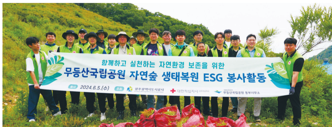
광주도시공사 임직원 25명은 대한적십자사 광주전남지사 회원들과 함께 지난 5일 무등산국립공원에서 자연숲 생태복원 ESG 봉사활동을 전개했다.