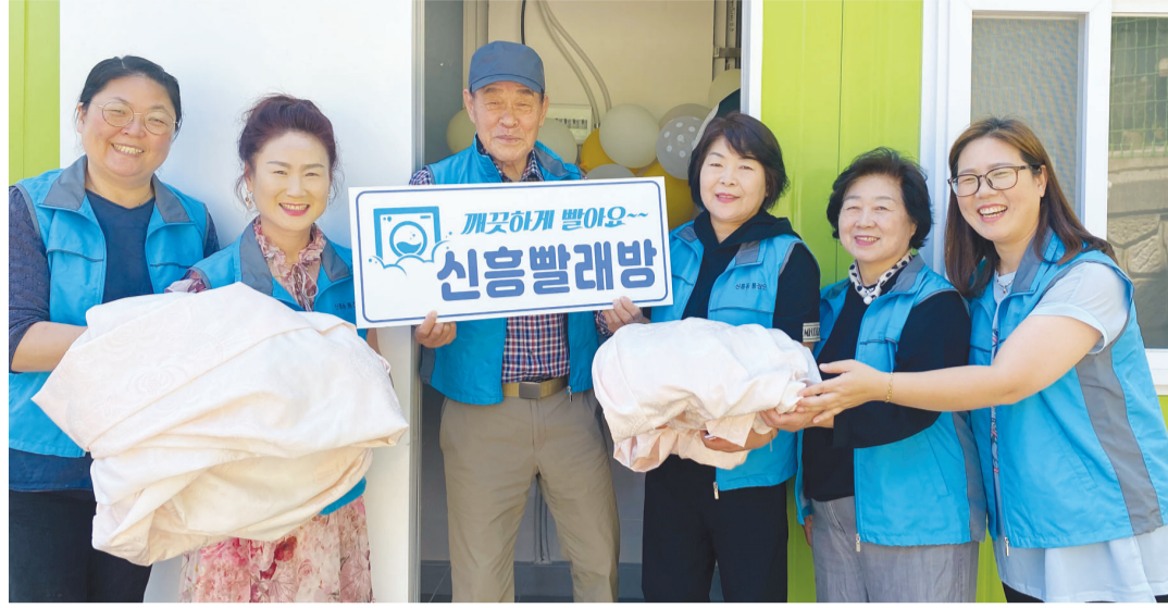
광산구 신흥동 주민자치회 복지분과 회원들은 주 1회 신흥빨래방을 운영하고 있다.

형 빨래 위주로 해드려요. 사실 젊은 사람들도 집에서 세탁하기 힘들죠. 가정집 세탁기에는 들어가질 않아 방치된 빨래감을 세탁하고 있습니다.” 주요 지역사회보장협의체에서 발굴한 사각지대 어르신과 노인들을 대상으로 주 1회 빨래하는 날을 정해 운영한다. 회원들도 직접 경로당을 방문해 병원 입원 후 귀가한 사람 등을 찾는다. 단순히 빨래만 하는 것은 아니다. 마을 주민들의 안부를 살피는 일도 하고 있다. 빨래하기 전 안부살핌 대상자를 방문해 의사를 묻고 빨래감을 수거, 배달하며 최소 2번 이상은 직접 만나 아픈 곳은 없는지 인사를 나눈다. 또 다른 이웃이 병원에 입원했다는 소식 등을 주고 받으며 마을의 연력 체계를 꾸준히 이어가고 있다. 회원들은 빨래 뿐만 아니라 세제, 생수 구매 등 심부름도 하고 병원 동행하기 등 마을 어르신들의 자녀 역할을 톡톡히 하고 있다. 장 분과장은 “우리들이 힘들어도 어떻게 더 편하게 해드릴까만 자주 생각하게 된다”며 웃었다. 이런 마음이 통해서일까.