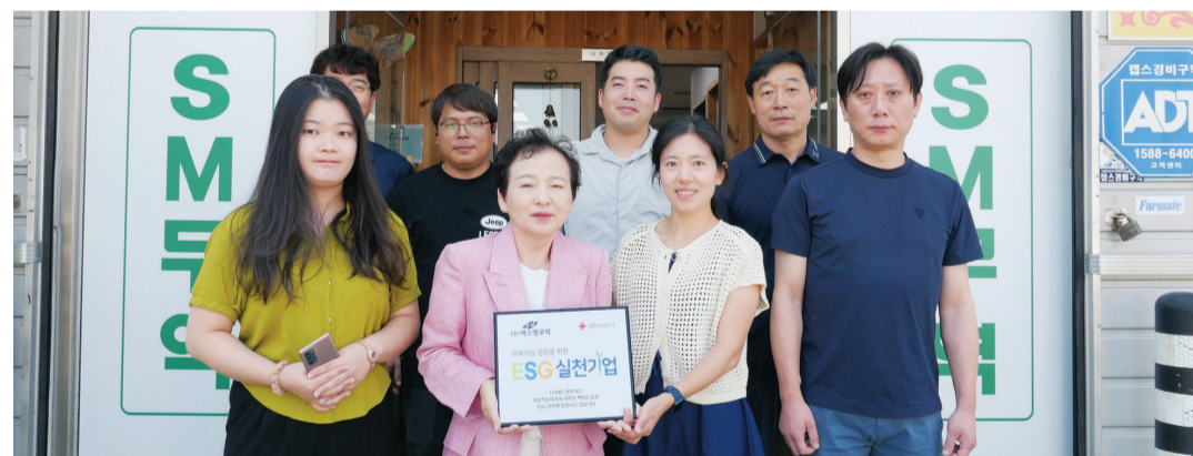
소형농기계 전문 기업인 ㈜에스엠무역(대표 박호영)이 대한적십자사 ‘ESG 실천기업’ 캠페인에 동참, 월 100만 원 정기후원을 약속했다.