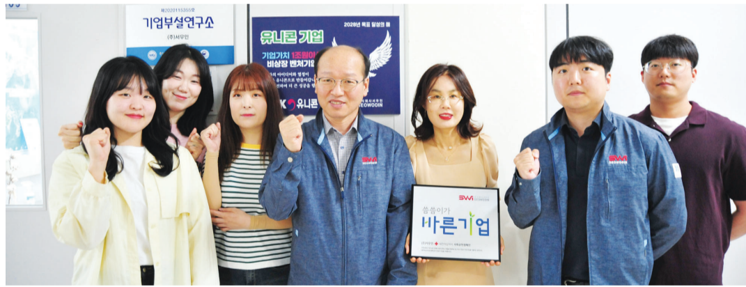
대기 환경 문제 해결을 위한 제품을 연구하고 개발하는 사회적기업 (주)서우인이 최근 대한적십자사 ‘숨숨이바른 기업’ 캠페인에 동참하고 정기 후원을 시작했다.