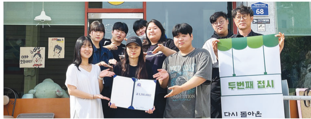
호남대학교 외식조리학과 창업동아리 ‘소우교우’는 호대동양연구소와 함께 산학연계 팝업 창의레스토랑을 운영해 거둔 수익금 320만 원을 LINC3.0사업단내 외식장학금으로 기탁했다.