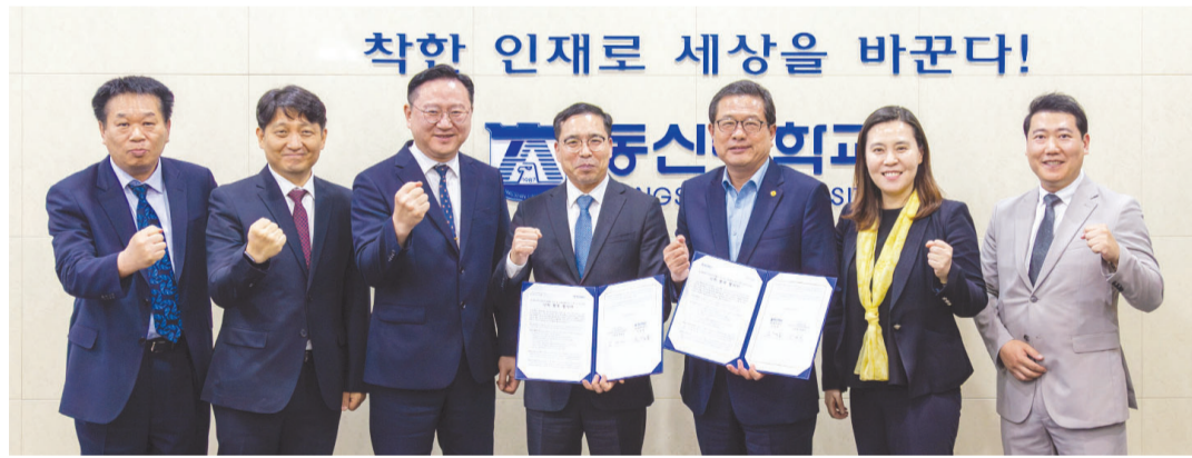
동신대학교는 지난 12일 주식회사 라한호텔과 '동신대 연합의 글로벌대학 UCC 성공 추진 및 호텔·관광 분야 인재 양성을 위한 협약'을 체결했다.