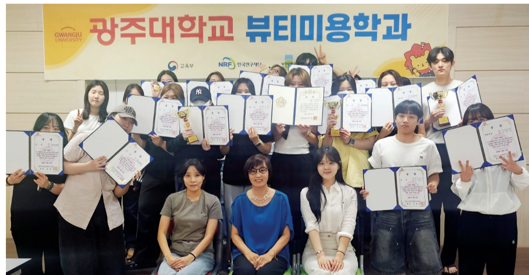
광주대학교 뷰티미용학과 재학생 32명이 (사)한국미용문화사연구협회 주최로 열린 '2024 국제 K-뷰티미용 콘테스트'에서 헤어, 피부, 메이크업 및 네일 분야에 출전해 전원 수상했다.