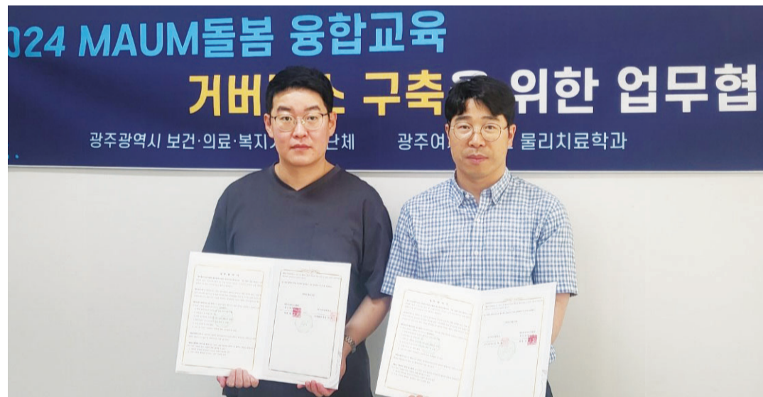
광주여자대학교 물리치료학과는 지난 19일 대한물리치료사협회 광주광역시회와 'MAUM돌봄 융합교육 거버넌스 구축을 위한 업무협약'을 체결했다.