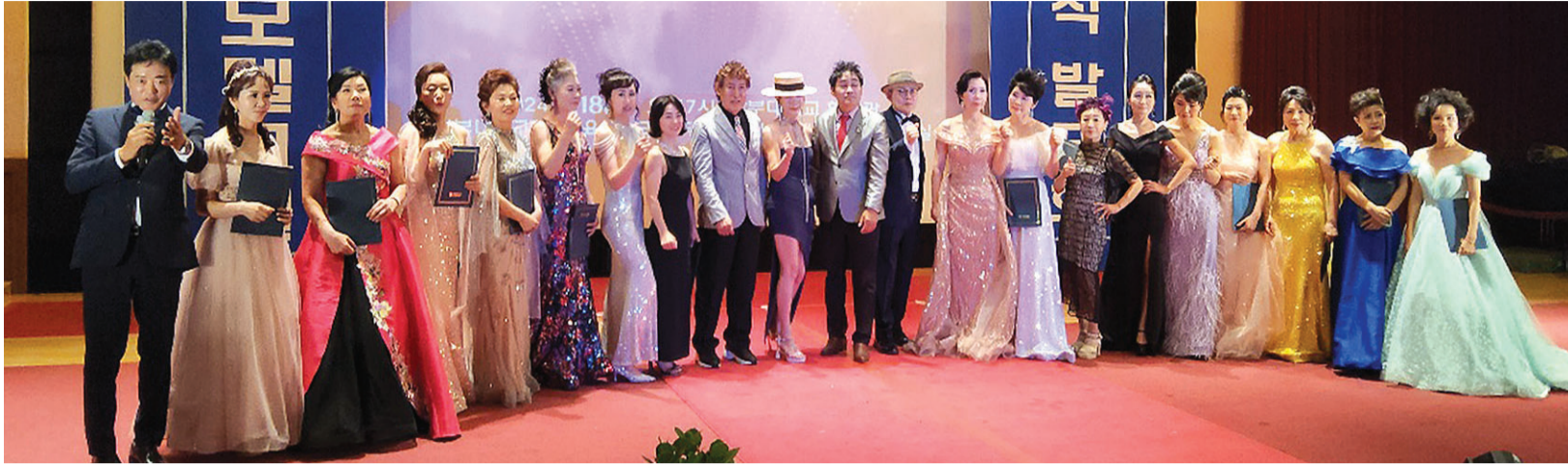
지난 18일 남부대학교 평생교육원 시니어모델교실 제10기 수강생들이 패션쇼 무대를 펼쳤다.

“커리큘럼 첫 번째는 올바른 걷기입니다. 걸음걸이가 바뀌면 체형이 바뀌고, 내 몸이 변화가 생기면 자신감도 불고 열정이 생기게 되죠. 부정적인 마음