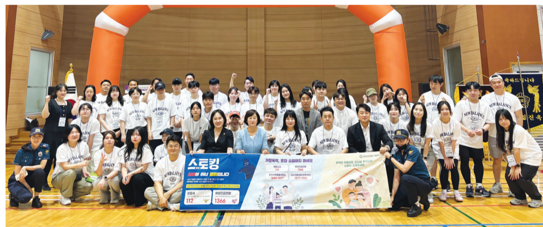
광주남부경찰서가 지난 21일 광주시 남구 다목적체육관에서 열린 제1회 한마음체육대회에서 청년들을 대상으로 스토킹, 교제폭력 예방 홍보 캠페인을 진행했다.