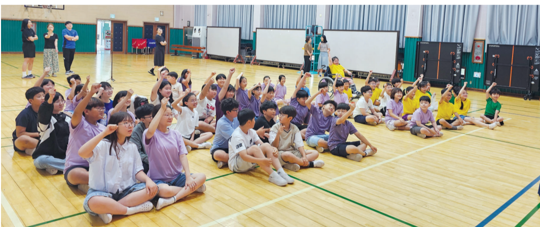
(재)전남도청소년미래재단이 지난 25일 신안군 압해도에서 ‘학교폭력·청소년폭력 추방운동사업’의 하나로 섬 지역 아이들을 위한 ‘학교폭력예방 교육 퀴즈쇼’를 개최했다.