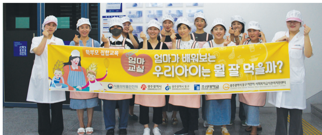
조선대가 위탁운영하는 광주 동구 어린이·사회복지급식관리지원센터는 지난 21일 조선대 솔마루 급식조리실에서 어린이집 및 유치원 학부모 대상으로 요리 교육을 열었다.