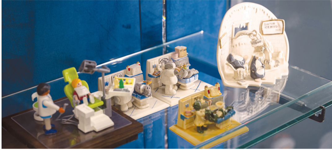
미래아동치과에서 열고 있는 ‘덴탈 미니어처전’에 전시된 구강 보건 관련 모형들.

전시물 중에는 치의학 변천사를 보여주는 작품, 현대 치의학의 성과를 보여주는 작품도 있다. ‘현재의 치과 진료실’은 현대식 치과 베드부터 서약식 기