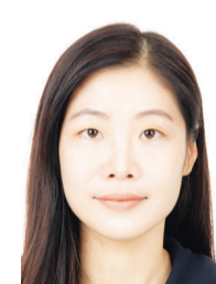
동체적 돌봄 공간을 수시로 변형시키면서 젠더 규범의 균열과 변화를 경험한 것이라고 분석했다. 1984년 창립된 한국여성학회는 학문적 깊이와 창의성을 가진 여성학 논문을 발표한 박사학위 취득 10년 이내의 신진 여성학 연구자에게 7년째 학술논문상을 수여하고 있다. /윤영기 기자 penfoot@

추 교수는 우리나라 할머니들이 생애 전반 노동과 돌봄 활동에서 중추적인 역할과 적취를 경험하기도 하지만, 집성촌이라는 혈연을 기반으로 한 공