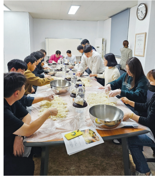
니만의 전통주 만들기 원데이 클래스.

가 전통주라는 이색적인 소재에 빠져 장 대표와 함께 창업의 길로 뛰어 들었다. 처음에는 고리타분하다고 생각했던 전통주였지만, 쌀과 물, 누룩 세 가지의 재료가 발효 돼 술이 만들어지는 과정을 재미를 느꼈다. 두 사람은 원데이 클래스 뿐만 아니라 자격증 수업, 사업 컨설팅을 진행하고 있으며 대학 창업 캠프와 지자체 강의 등을 나서며 바쁜 날을 보내고 있다.