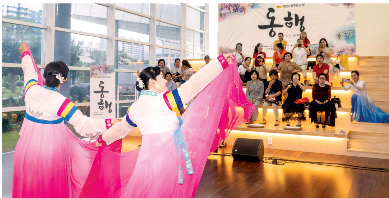
북한이탈주민의 날 기념 북한이탈주민의 날(7월 14일)을 기념해 10일 오후 광주시청 시민홀에서 기념행사 ‘동행’이 열리고 있다. 식전행사로 주민들의 공연이 진행되고 있다.