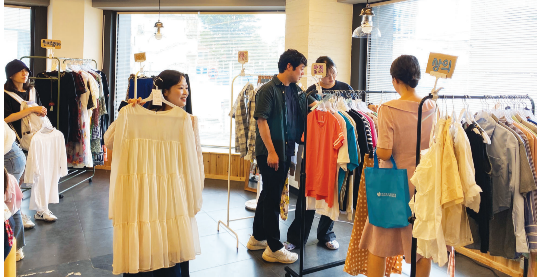
지난 13일 한결을 가게에서 열린 '의류 교환 파티-바꿔 입장' 행사에서 참여자들이 옷을 고르고 있다.