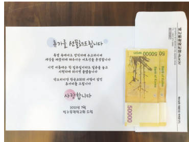
편지와 휴가바 10만 원.