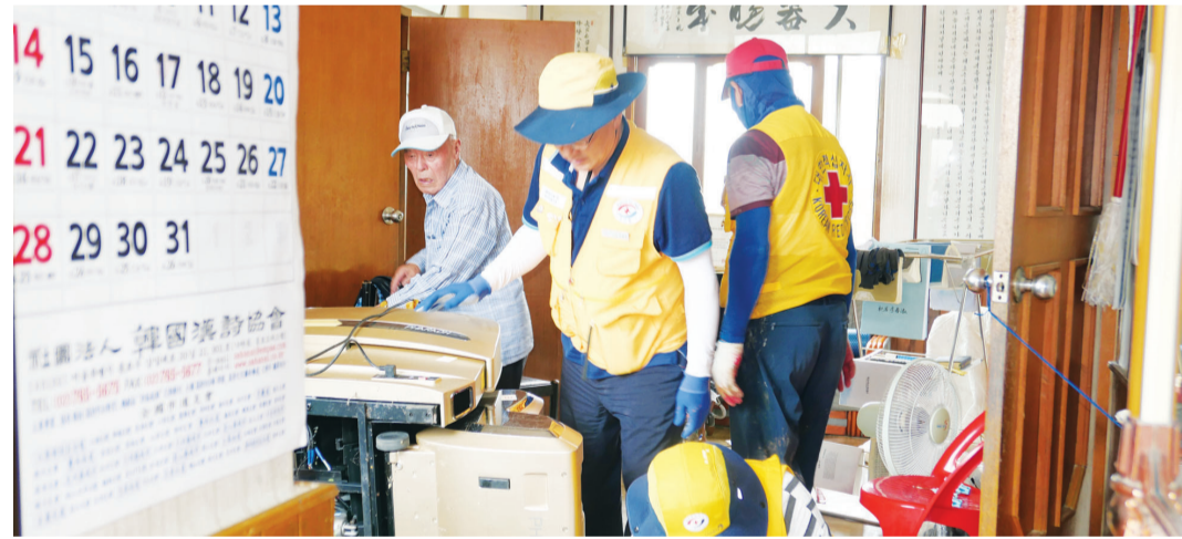
대한적십자봉사회 광주전남협의회 소속 봉사원 200여 명은 최근 진도 의신면, 완도읍, 신지면, 고금면, 해남 화산면에서 수해 복구 작업을 실시했다.