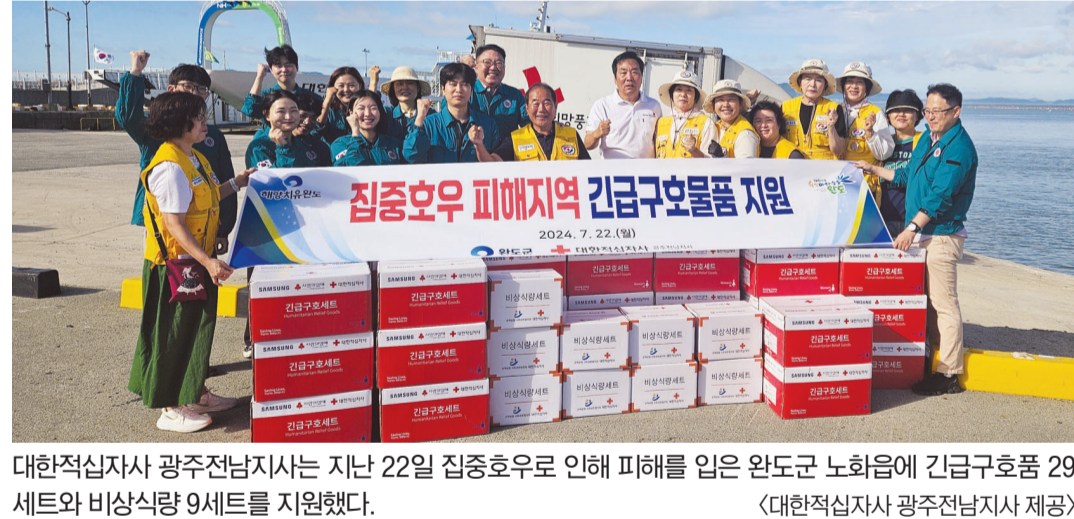
대한적십자사 광주전남지사는 지난 22일 집중호우로 인해 피해를 입은 완도군 노화읍에 긴급구호품 29 세트와 비상식량 9세트를 지원했다.