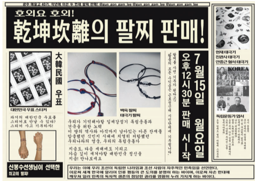
'건곤감리 프로젝트' 홍보 포스터.