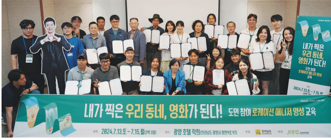
전남영상위원회가 진행한 도민참여 로케이션 매니저 양성교육 참여자들.

았다. 7월 초 광양에서 진행된 교육에는 이상근 링크웹 대표, 이상용 로케이션 디렉터 등이 강사로 참여해 특강을 진행했으며 사진 촬영, 촬영지 선정 방법 등 기본 로케이션 교육이 이뤄졌다. 참가자들은 이순신 대교, 광양해양공원, 인사리 공원, 백운산 휴양림 등에서 직접 로케이션 체크리스트를 작성하고 촬영을 하며 실습을 진행했다. “로케이션 장소를 찾아 데이터 베이스를 구축하는 데 영상위의 활동만으로는 한계가 있어 전남도민들의 힘을 빌리기 위해 시작한 프로젝트입니다. 이들 매니저들이 직접 발굴한 촬영지는 드라마 촬영 유치 활성화를 위해 구축중인 '전남필름' 플랫폼에 등록돼 폭넓게 활용될 예정입니다.” 이번 기획의 담당자인 서상훈씨는 “참가자들이 로케이션 매니저라는 직업에 익숙하지 않은데다 바로 DB 구축작업에 참여해야 하는 상황이라 실무 위주의 교육을 진행했다”고 밝혔다. 이번에 선발된 22명의 로케이션 매니저는 20대