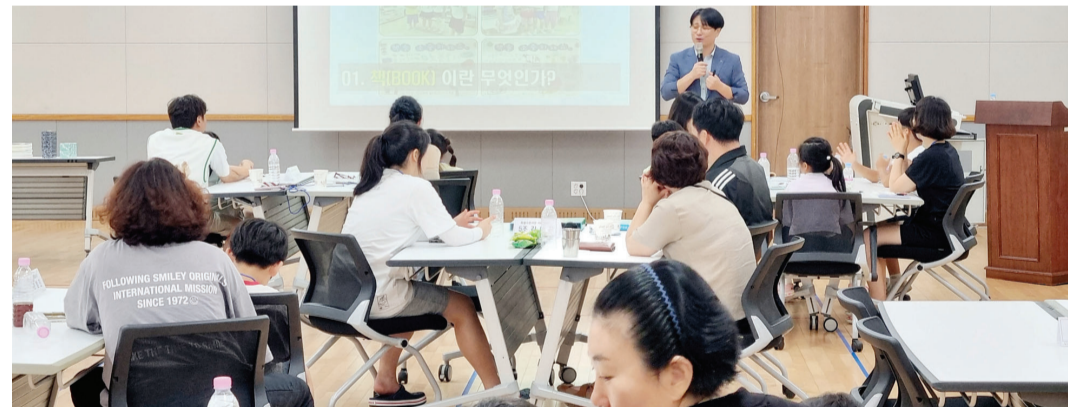
광주시교육청은 지난 25~26일 광주학생해양수련원에서 초·중·고등학교 재학생 가족 10개 팀 42명이 참여한 가운데 '2024 바다로 떠나는 가족 독서 캠프'를 운영했다.