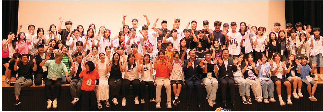
지난 2일 해남문화예술회관에서 열린 '최수종과 함께하는 연기캠프' 작품발표회에서 최수종을 비롯한 캠프 참가자들이 기념사진을 촬영하고 있다.

다”며 “이번에 전문가들과 함께 작업을 해보고 진로에 좀 더 확신이 생겼다”고 말했다.