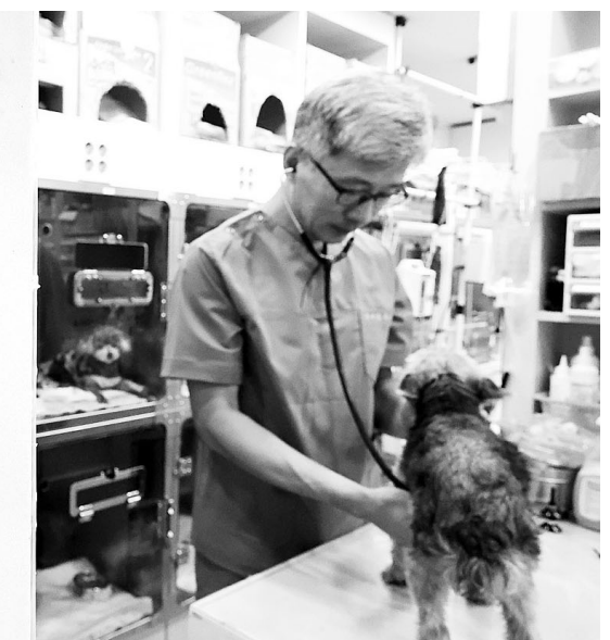
동물보호법에 따른 '동물등록 자진신고 기간'이 시작된 5일 서울 동작구 동물등록 대행기관인 쿠포파 24시 반려동물건강검진센터에 관련 안내문이 붙어 있다. 법에 따라 주택·준주택에서 기르거나 이외의 장소에서 반려 목적으로 기르는 2개월령 이상인 개는 의무적으로 등록해야 한다.