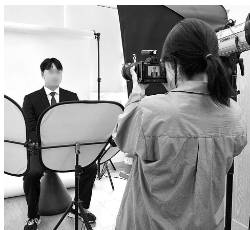
전문 사진작가가 서구 치평동 광주청년센터 '토닥토닥 3센터' (옛 토닥토닥 청년 일자리 카페)에서 구직 청년 이력서 사진을 촬영하고 있다.

이 밖에도 광주시가 신규 운영하는 청년일자리 스테이션과 자치구에서 운영하는 청년센터(아지트(동구), 청춘발산공작소·청년센터플러스(서구), 청년와타(남구), 청춘이랑(북구), 청정플랫폼(광산구) 등)에서도 청년 취·창업 지원 서비스를 받을 수 있다.