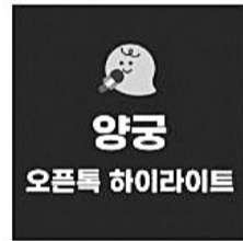
[오픈톡 하이лай트] '양궁 여자 개인 결승에서 내전' - 임시현 금... 2024. 8. 3. 1