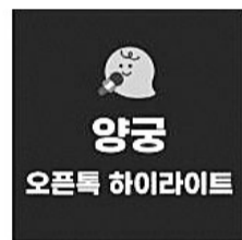
[오픈톡 하이лай트] '한국 역대 최다 금메달리스트' - 김우진 금메... 19시간전 5

'팀코리아' 탭 내 대표팀 응원 클릭 수는 1000만 건에 달한다. 5일 기준으로 가장 많은 응원을 받은 선수로는 유도의 김하은 선수로, 50만 건의 응원을 받았다. 또 안세영 선수를 향한 응원도 37만 건을 넘었고 양궁 대표팀의 김우진, 임시현, 전현영 선수에게도 33만 건 이상의 응원이 이어졌다.