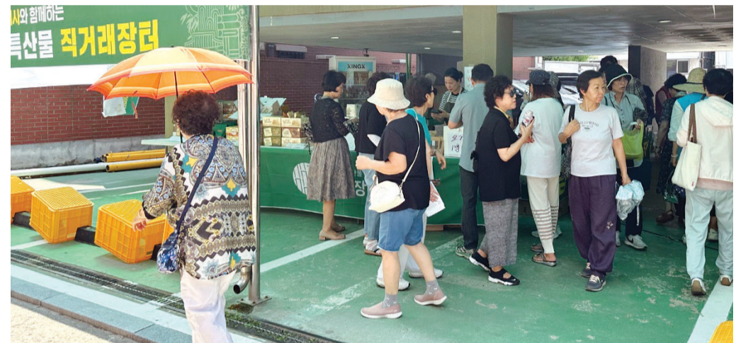
서울 조계사에서 열린 농특산품직거래장터에서 방문객들이 담양 농특산품을 구입하고 있다.

담양군이 대도시 소비자들을 겨냥한 직거래장터를 열고 담양 농특산품의 우수성을 알렸다. 담양군은 지난 4일부터 6일까지 대한불교 총본산 서울 조계사에서 담양 농특산품 직거래 장터를 열어 한과, 떡갈비 등 40여가지 품목을 판매했다.