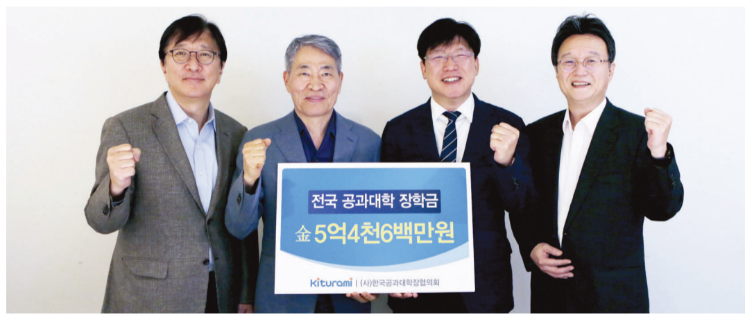
귀뚜라미그룹은 지난 6일 (사)한국공과대학협의회에 ‘귀뚜라미 전국 공과대학 장학금’ 5억 4000여만원을 전달했다.