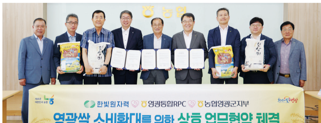
한빛원자력본부는 지난 1일 영광농협쌀조합공동사업법인과 영광쌀 브랜드를 전국에 홍보하고 지역 농가의 매출 증대를 위한 ‘영광쌀 TV홈쇼핑 방송 지원 사업’ 협약을 체결했다.