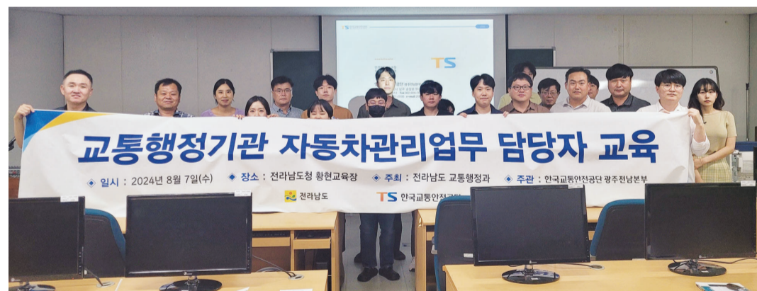
한국교통안전공단 광주전남본부는 최근 전남도 22개 시·군의 자동차관리업무 담당 공무원을 대상으로 전남도청에서 불법자동차 단속업무에 대한 역량강화 교육을 실시했다.