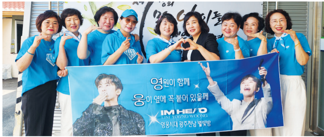
가수 임영웅 팬클럽 ‘영웅시대광전별빛방’은 지난 8일 임영웅의 데뷔 8주년을 맞아 광주영아일시보호소에 기부금 310만 원을 전달하고 봉사활동을 진행했다.

“영웅씨는 팬클럽 ‘영웅시대’ 이름으로 기부하고, 영웅시대는 ‘임영웅’ 이름으로 기부해요. 서로 따라하며 좋은 영향을 주고받는 거죠. 지역 팬카페 회원들도 기념일을 맞이해 당연히 자발적으로 하겠다는 생각을 하고 있어요. 그래서 기부금을 모금하기가 편하죠.”