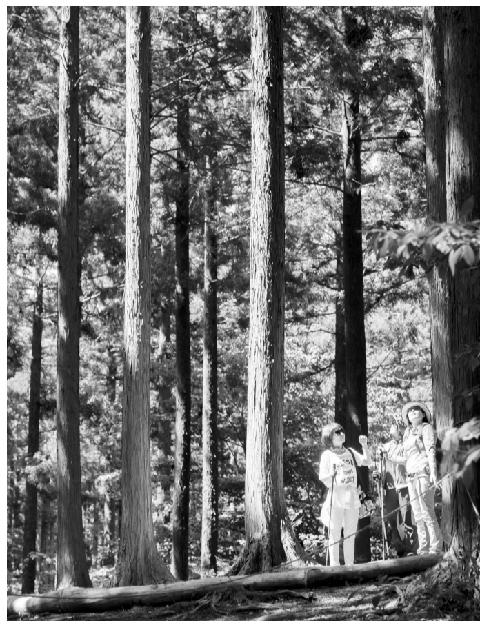
장성 축령산 '치유의 숲'.

/이보람 기자 boram@kwangju.co.kr