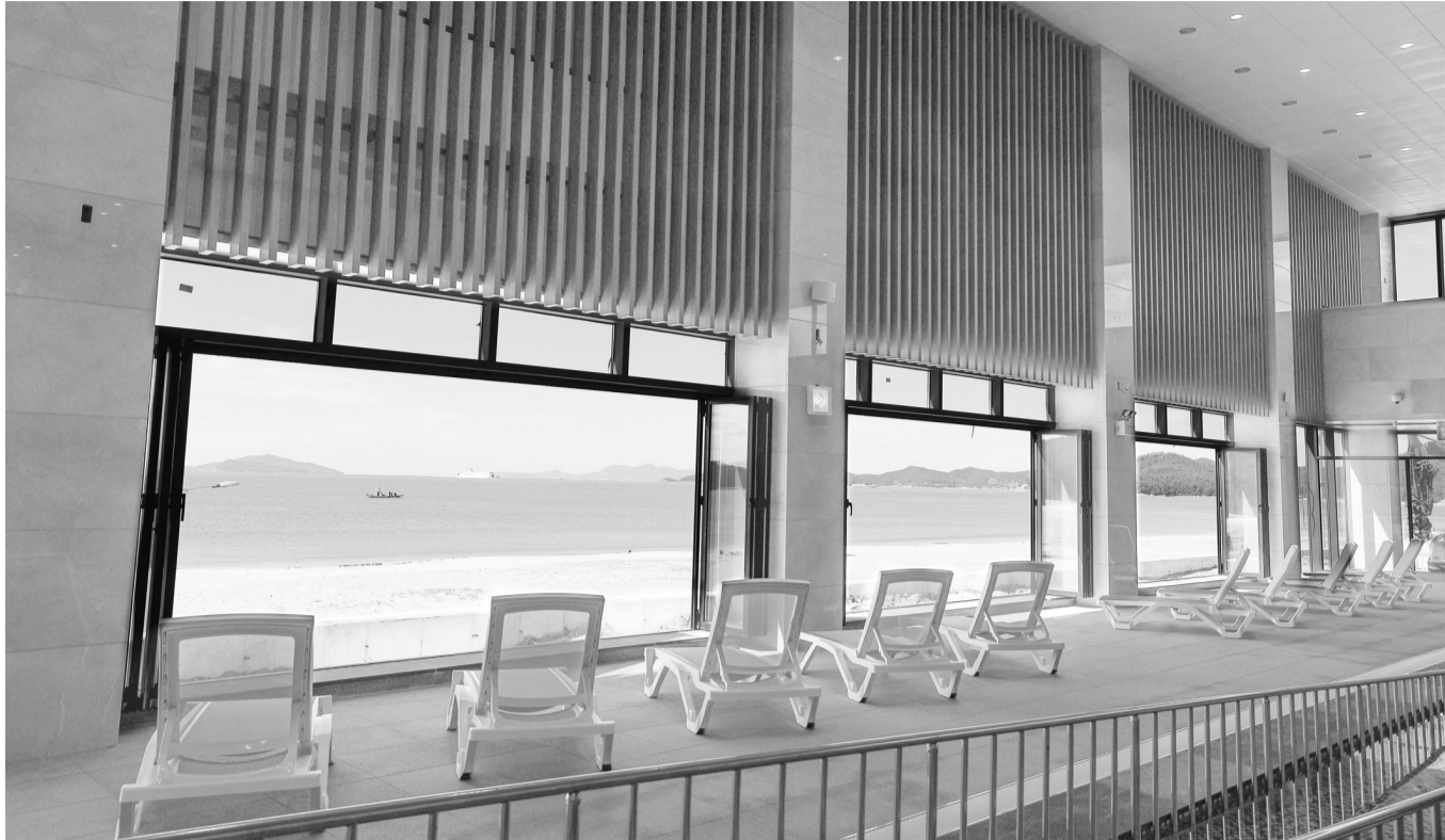
완도해양치유센터 1층 달라스포에서 바라보는 완도의 푸른 바다.