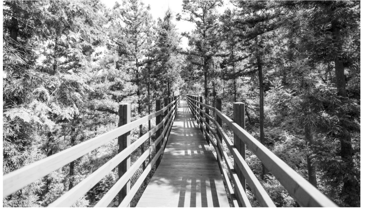
장흥 정남진 편백숲 우드랜드 하늘데크는 '사색의 숲'과 연결된다.