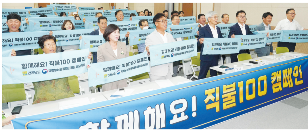
전남도는 23일 전남도농업인지원센터에서 22개 시·군, 국립농산물품질관리원 전남지원 등 농업단체 관계자 100여 명이 참석한 가운데 공익직불금 감액 예방을 위한 ‘직불100 캠페인’ 출범식을 가졌다.