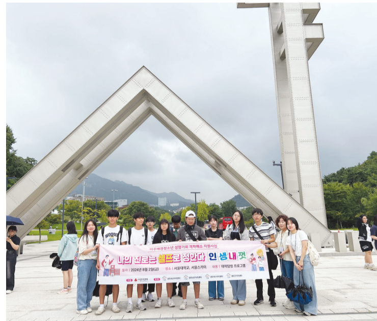
광주시 가족센터에서 학습 코칭을 받는 이주배경청소년들은 지난 2일 서울대학교를 탐방하는 진로 체험학습에 참여했다.

한편, 사회복지공동모금회 지원을 받아 올해 첫 시행하는 이번 사업은 베트남, 중국, 필리핀 등이