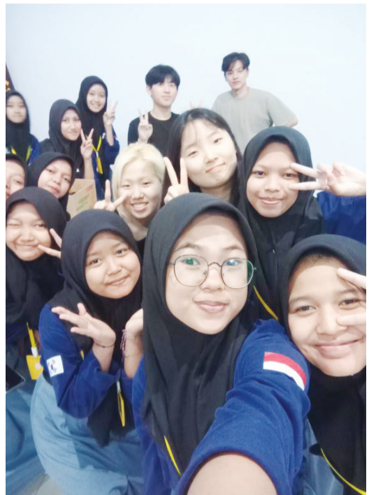
GIST IT 봉사단 학생들과 ICT 교육을 받은 인도네시아 SMABAKTI PONOROGO 고등학생들.