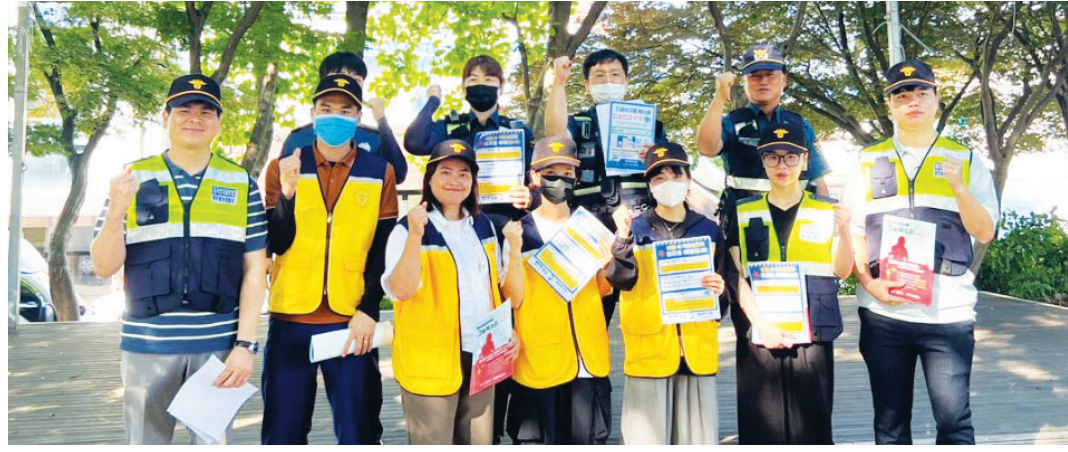
범죄 예방에 기여하는 광산구 월곡동 외국인자율방범대.

방범대원들은 미성년 학생들이 공원에서 술을 마시는 것을 목격할 때면 주의를 주며 지도하고 있다. 또 외국인 사업주에게 미성년자에게 술, 담배 파는 행위가 불법이라는 점과 폭행 당하거나 물건을 도둑맞았을 때 신고하는 방법도 알린다. 대원들은 동