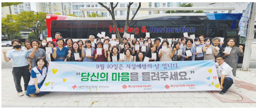
대한적십자사 광주전남지사가 수탁 운영 중인 광주재난심리회복지원센터는 최근 ‘9월 10일 세계 자살예방의 날’을 맞아 생명존중 문화 확산을 위한 자살예방캠페인을 진행했다.