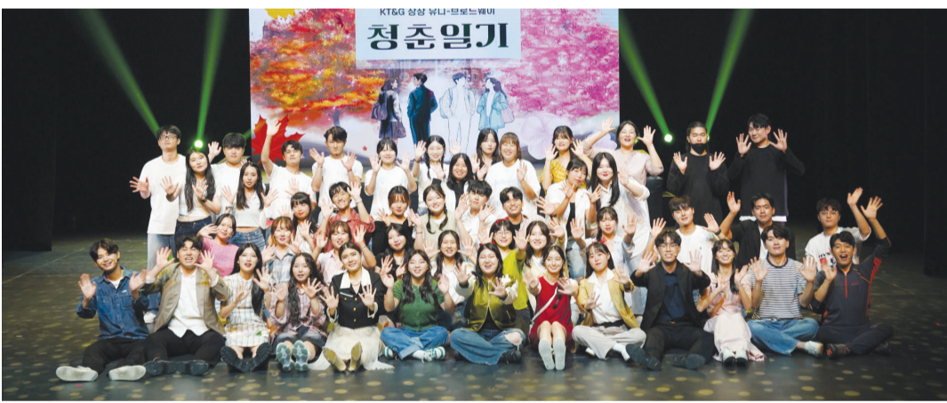
KT&G 상상유니브 전남영사사무국이 지난 6일 ACC에서 대학생 등 20대 청년의 이야기를 극화한 대학생 창작 뮤지컬 ‘2024 KT&G 상상 유니-브로드웨이 청춘일기’를 선보였다.