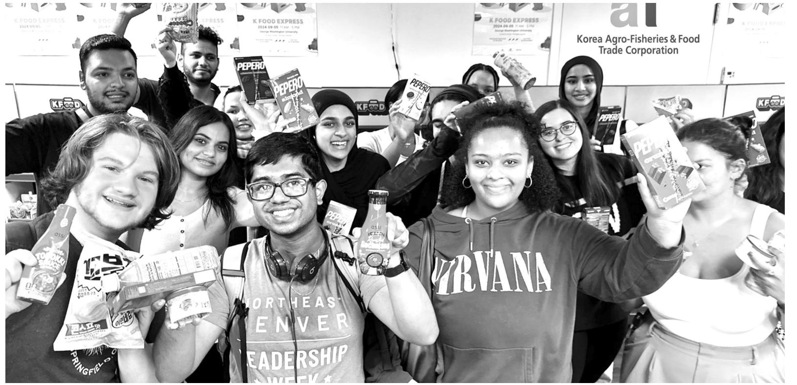
조지워싱턴대에 한국 편의점이 미국 워싱턴D.C. 조지워싱턴대학교 학생들이 '라면', '빼빼로', '꼬북칩' 등 K-푸드를 들고있다. 한국농수산식품유통공사(aT)는 농림축산식품부와 함께 지난 5일 조지워싱턴대학교에서 다양한 K-푸드를 홍보하는 'K-푸드 익스프레스' 행사를 개최했다. 이번 행사는 미국 학생들이 새 학년을 맞이하는 개강 시기에 발맞춰 한국 편의점을 미국 대학 캠퍼스에 옮겨놓는 팝업스토어 형식으로 진행됐다.