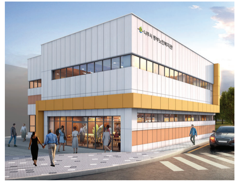
나주시 동부노인복지관 별관 신축 투시도.

나주시는 복지관 증축이 마무리되면 초고령화 사회에 대비하는 동부권 거점지역의 플랫폼 역할을 할 수 있을 것으로 기대한다.