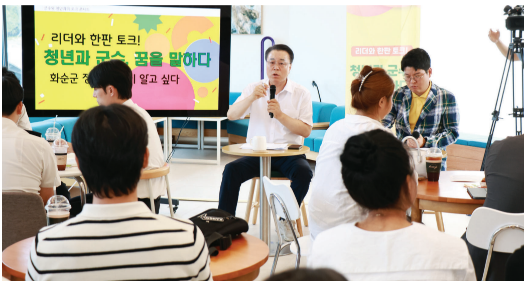
구북구(가온데) 화순군수는 지난 20일 지역 청년 30여명을 초청해 '청년과 군수, 꿈을 말하다'라는 주제로 토크콘서트를 개최했다.