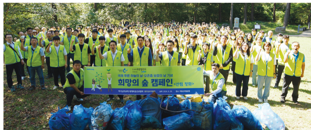
하나님의교회 세계복음선교협회가 최근 교회 신자와 가족 등 200여 명이 참여한 가운데 무등산 국립공원 일원에서 '희망의 숲' 캠페인을 펼쳤다.