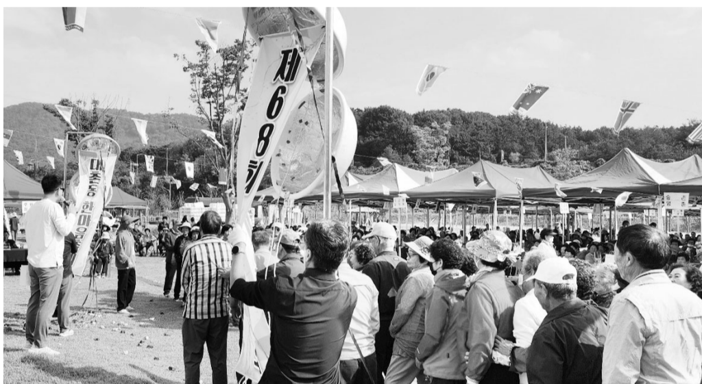
8일 광주시 남구 빛고를 농촌테마파크에서 대촌동 한마음축제 및 제68회 체육대회(추진위원장 김진호)가 1000여 명의 주민들이 참석한 가운데 성황리에 펼쳐졌다.