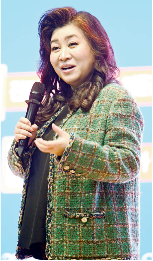
10일 호남대를 찾은 ‘국민 멘토’ 오은영 박사가 학생들에게 ‘행복을 찾아가는 길’에 대해 조언하고 있다.

‘국민 멘토’ 오은영 박사가 호남대학교 재학생과 교직원들을 위한 특별 강연을 개최했다. 소아청소년 정신건강의학과 전문의인 오은영 박사는 10일 오후 호남대 문화체육관에서 ‘진로 선택과 자존감’·‘반려동물과 정신건강’이라는 두 가지 주제로 진로와 인생 고민에 대한 실질적인 조언을 제시했다. 미국락 가수 로이 오비슨의 ‘Oh, Pretty Woman’이 흘러나오고 오은영 박사가 행사장에 들어서자 학생들의 환호성이 쏟아져 나왔다. 오 박사는 객석을 돌며 잔잔히 참석자들과 눈을 맞추고 손을 맞잡으며 ‘그’만의 밝고 따뜻한 인사로 화답했다. “여러분, 행복하십니까?” 무대에 오른 오 박사는 대담 객석을 향해 질문을 던졌다. “우리는 모두 행복한 권리가 있지만 언제나 행복하지는 않아요. 그렇지만 대체로 행복해야 합니다. 이 세상에 유일한 존재인 우리는 존재 자체가 너무 귀하고 소중한 사람이기 때문입니다.” 그는 “추상적인 가치인 ‘행복’은 상대적이고 주관적이지만, 각자 느끼는 행복의 정의가 다르다”며