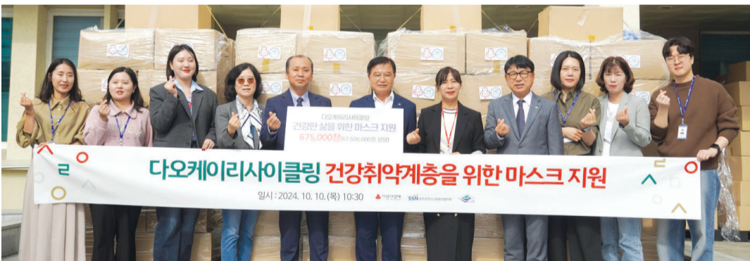
다오케이리사이클링이 10일 광주사회복지공동모금회를 통해 건강취약계층을 위한 6750만원 상당의 마스크 67만5000개를 전달했다.