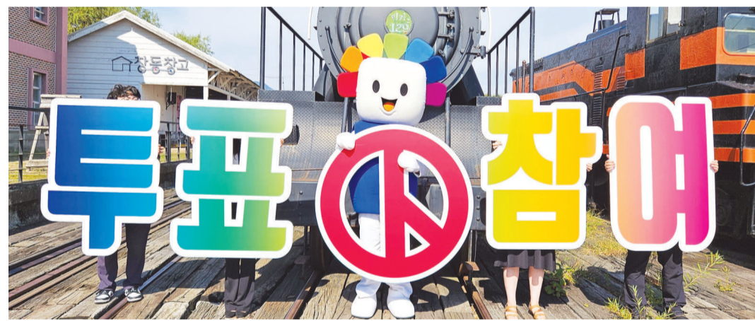
전남도 선거관리위원회는 10·16 재선거를 앞두고 13일 곡성 섬진강 기차마을에서 투표참여 홍보 캠페인을 실시했다.