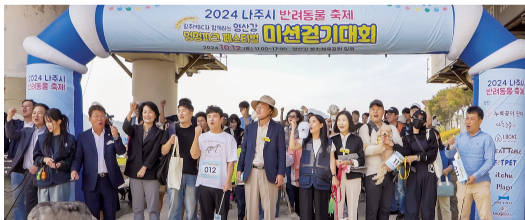
‘나주시 반려동물 축제(영산강 멍멍파크 페스티벌)’가 지난 12일 영산강 둔치체육공원에서 열렸다. 축제에는 500여 명이 반려견과 함께 참여했다.