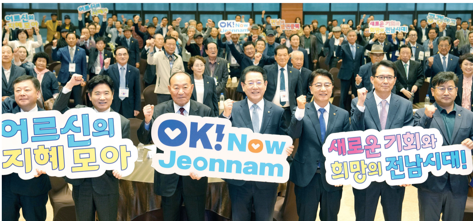
전남 노인의 날 기념식 김영록 전남지사가 15일 무안군 남악스카이웨딩컨벤션에서 열린 제28회 전남도 노인의 날 기념식에 참석해 참석자들과 기념 촬영을 하고 있다.