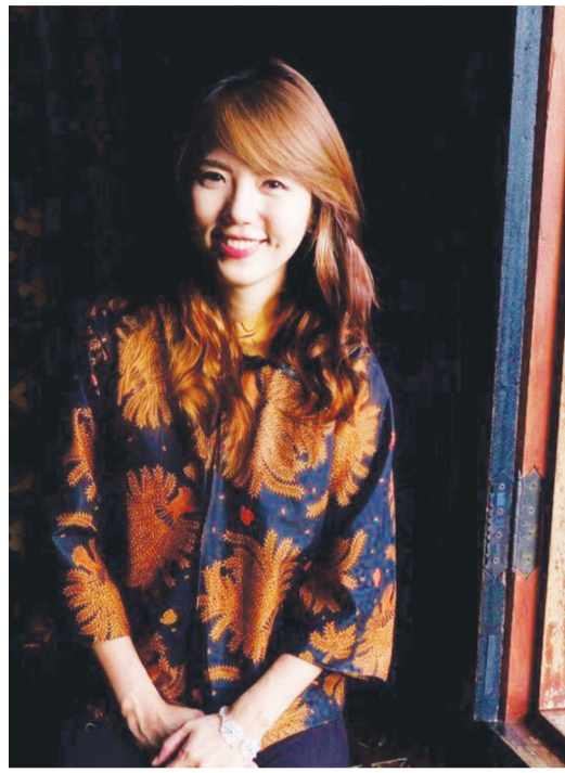
살아온 환경과 섬은 꼭 닮아있는 것 같다고 했다. “섬에서는 매 순간 한계 상황을 만나요. 주어진 자원을 가지고 어떻게 생각하고 능력을 발휘하느냐에 따라 생존 여부가 갈리죠. 섬은 비교 대상이 없어요.”

“We are all islanders(우리는 모두 섬 사람들이다)”라는 메시지에서 섬에 대한 애정을 엿볼 수 있을 정도로 그의 섬 사랑은 특별하다. 심대에 겪은 가정의 어려움, 20대에 했던 암 수술 등 고난이 연이어 닥쳤지만, 때 순간 치열하게 살아왔다. 그는 자신이