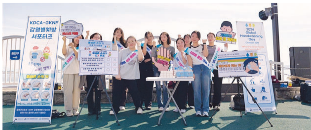
광주여자대학교 간호학과 감염병 예방 서포터즈와 전남도청 감염병관리지원단은 ‘세계 손 씻기의 날’(10월 15일)을 맞아 14일 목포 평화광장에서 손 씻기의 중요성을 알리는 캠페인을 벌였다.