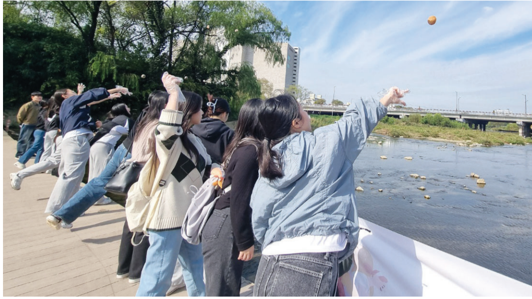
금호중앙여자고등학교 교사와 학생들은 최근 광주천 수질 개선을 위한 EM흙공 던지기 활동을 실시했다.

이밖에도 금호중앙여고에서는 친환경 활동을 적극 흙공을 만드는 법을 익혔고, 키트를 이용해 직접 흙공을 만들었다. 학생들은 곰팡이가 잘 자랄 수 있도록 학교와 집 그늘진 곳에 보관해 1주일 간 발효를