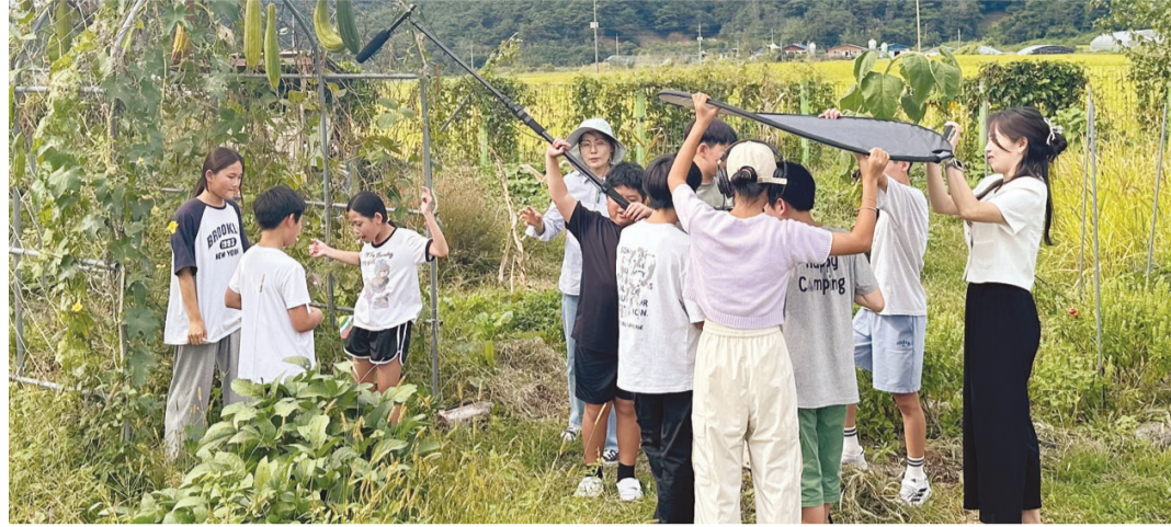
곡성 삼기초등학교 학생들이 영화 '감정이 사라진 시간'을 제작하고 있는 모습.

총 12회차 촬영이 끝나면 학생들의 의견을 바탕으로 편집을 하게 된다. 올해 촬영과 편집이 끝난 후 나의 이야기를 영상으로 표현해보는 방법 등 영화에 접근하는 개인의 방식들을 함께 나눌 계획이다. 지난해 12월 곡성군 작은영화관에서 제1회 달팽이 영화제에 참여했고 지난 9월에는 단편 영화 '말할 수 없는 비밀' 작품으로 '섬진강 마을 영화제'에 출품했다.