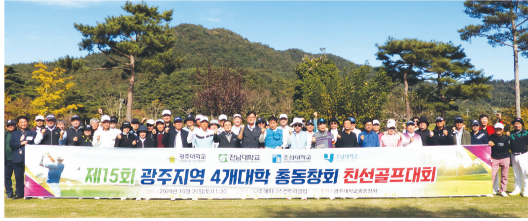
제15회 광주지역 4개대학(광주대, 전남대, 조선대, 호남대) 총동창회장배 친선골프대회가 26일 나주시 해피니스컨트리클럽에서 성황리에 개최됐다.