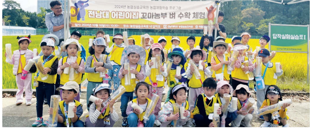
전남대학교 농업실습교육원(원장 이지웅)은 최근 교내 실험답작포에서 전남대 어린이집 유아들을 대상으로 꼬마농부 벼 수확 체험 프로그램을 운영했다.