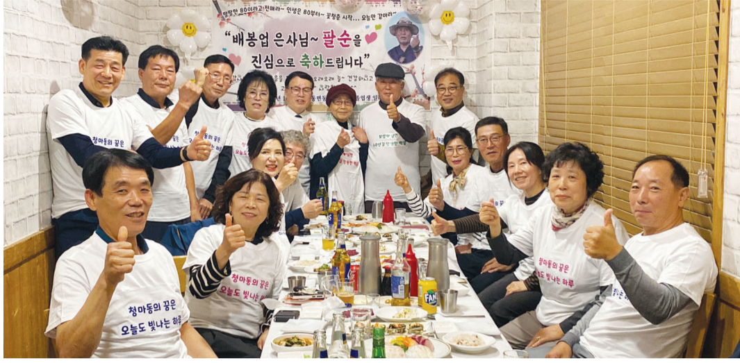
50년 전 초등학교 담임 선생님의 팔손 잔치를 마련한 화순 동면 동초등학교 9회 졸업생들.

며 직접 양봉한 꿀 한 병씩 제자들에게 나눠줬다. 가진 사람이 없는 사람을 돕고, 아는 사람이 모르는 사람을 가르쳐주고, 강한 사람이 약한 사람을 부추겨 줄 수 있도록 지도한 배 씨의 가르침을 제자들도 기억했다. 제자들은 ‘차별 없이 대해주시고 모든 학생을 아껴주시는 스승’이라고 입을 모았다.