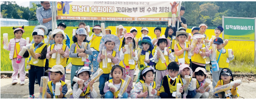
전남대학교 농업실습교육원(원장 이지중)은 최근 교내 실험답작포에서 전남대 어린이집 원아들을 대상으로 꼬마농부 벼 수확 체험 프로그램을 운영했다.