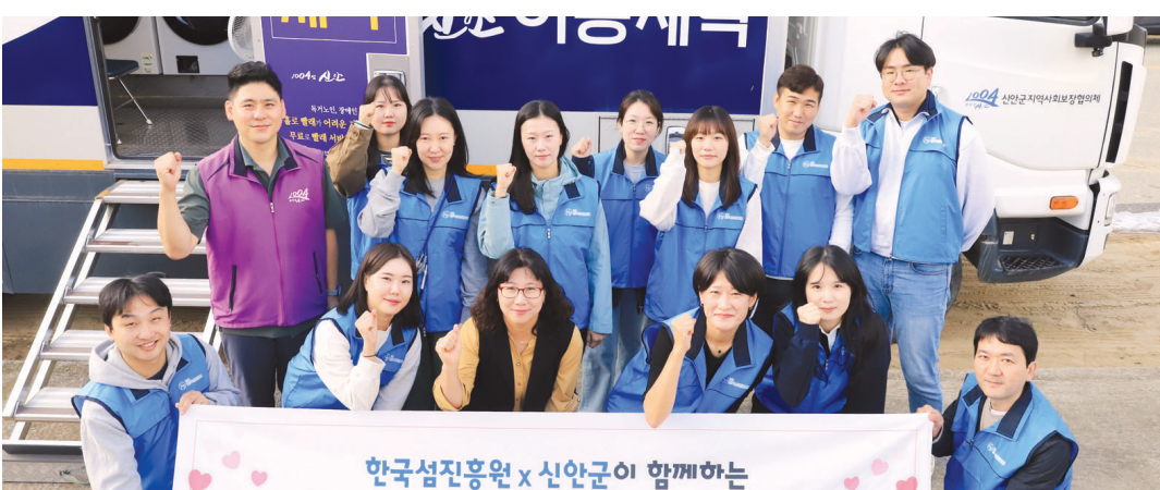
한국섬진흥원(KIDI)은 30일 오전 신안 자은도에서 섬진흥원 임직원과 신안군업체 관계자 등 15명이 참여한 가운데 ‘행복 세탁서비스’ 활동을 펼쳤다.