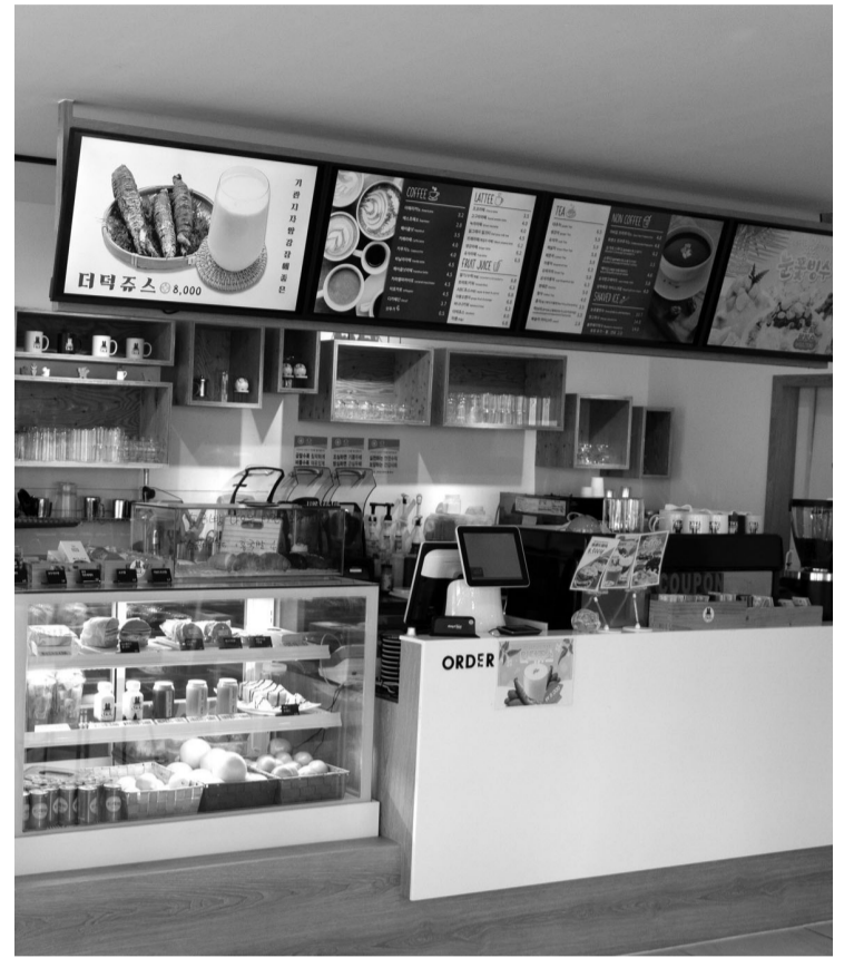
장흥지역 저소득층의 자활·자립을 위한 일자리 공간으로 문을 연 카페 '커피톡'.