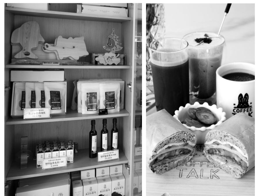
편백 도마·수제 차·디저트 등 모든 제품은 자활센터에서 직접만들어 판매한다.

/이보람 기자 boram@kwangju.co.kr